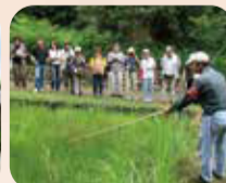
学习自然“健走向导”