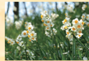
日本水仙 2月上旬~2月下旬

色彩單調的風景漸漸染上不同顏色的季節。早春的花卉(日本水仙、梅花、油菜花、聖誕玫瑰等)盛開，為園內增添色彩。