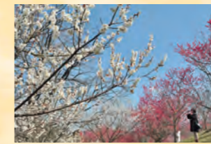
梅花 2月上旬~3月上旬