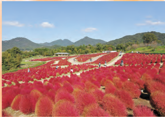
掃帚草 從綠色漸變成紅色(9月下旬~10月上旬)→鮮紅色(10月中旬) →從紅色漸變成小麥色(10月下旬)