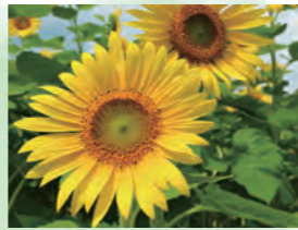
向日葵 7月中旬~7月下旬

「繡球花苑」為無障礙設計的立體花壇。使用輪椅或嬰兒車的遊客也能享受散步樂趣。此外，活動期間也提供和傘借用服務。