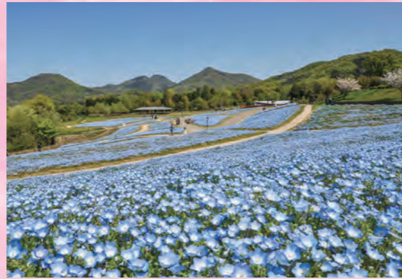
粉蝶花 4月上旬~4月下旬