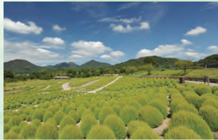
掃帚草綠葉 7月中旬~8月下旬