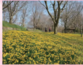
水仙 3月中旬~3月下旬

春季為各種花草染上鮮艷色彩，是最適合入園參觀的季節。水仙、鬱金香、粉蝶花等，仿如接力般地競相開放。