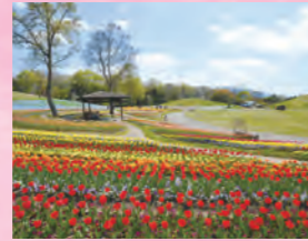
鬱金香 4月上旬~4月中旬