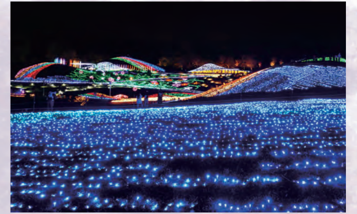
Grand Illumination 燈飾的配色及設計等，每年都會按照主題而有所不同。