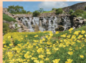
黃波斯菊 9月上旬~10月上旬