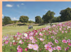
波斯菊 9月中旬~10月下旬

掃帚草青嫩的綠葉，隨著秋季來臨的同時，顏色也逐漸變化，10月中左右變成鮮紅色。秋季具代表性的花卉，波斯菊也頗具人氣。