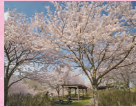
櫻花 3月中旬~4月上旬