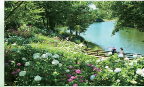
繡球花 6月上旬~6月下旬