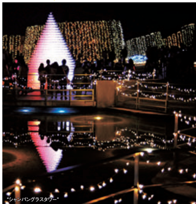
「シャンパングラスタワー」

また、広大な丘陵地を活かした立体的なデザインは、会場内に幾つかある小高い場所から見渡すことができ、煌びやかなパノラマをお楽しみいただけます。(約3万㎡のグランドイルミネーション、LED電球55万球、照明等を使用)