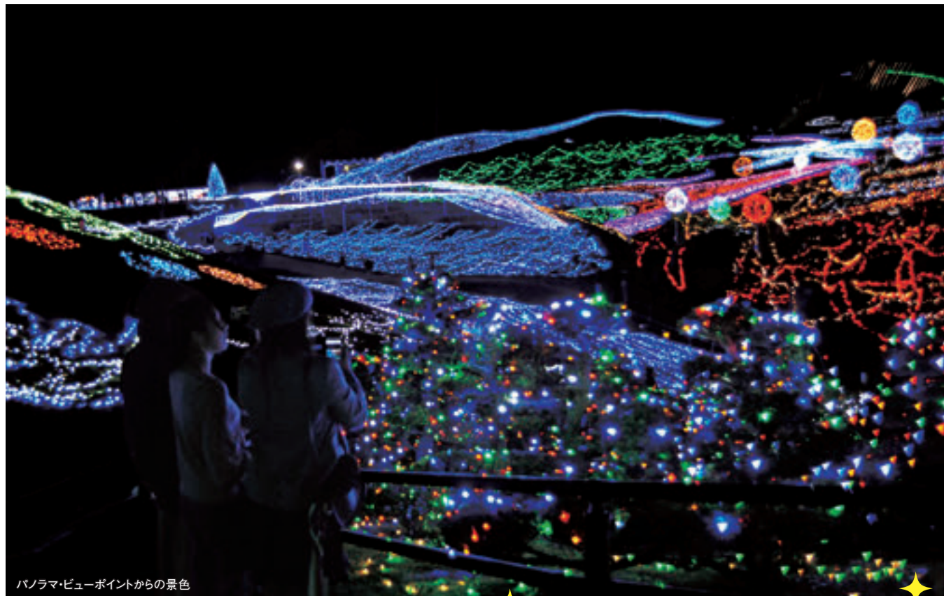
パノラマ・ビューポイントからの景色