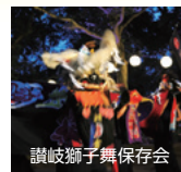
讃岐獅子舞保存会