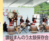
讃岐まんのう太鼓保存会