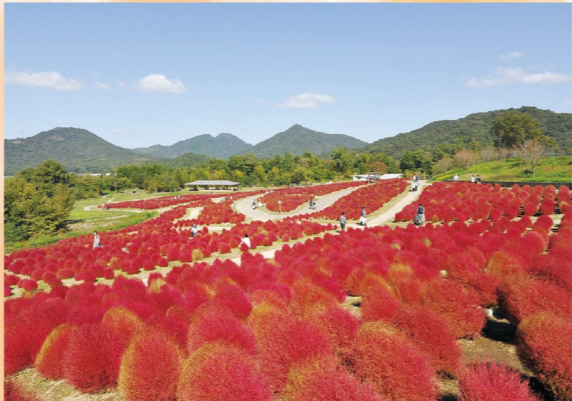
コキア 緑から赤へのグラデーション→真紅→赤から小麦色へのグラデーション (9月下旬～10月上旬) (10月中旬) (10月下旬)