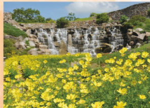
キバナコスモス 9月上旬～10月上旬

コキアの柔らかな緑葉は、秋の深まりとともに色が変わり、10月中旬には真っ赤に染まります。秋を代表する花、コスモスも人気です。期間中は、スポーツ・アウトドア・芸術などの各種イベントを開催します。