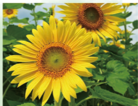
ヒマワリ 7月中旬～7月下旬

池のほとりに広がる「あじさい苑」は、バリアフリー構造となっており、車椅子やベビーカーでも安心してアジサイ観賞が楽しめます。アジサイの開花に合わせて、和傘やカラフル傘の無料貸し出しサービスなどを行っています。