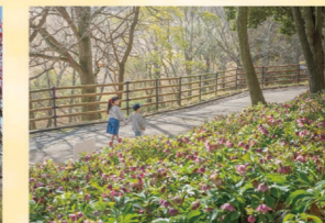
クリスマスローズ 2月上旬～3月下旬