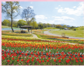
チューリップ 4月上旬～4月中旬