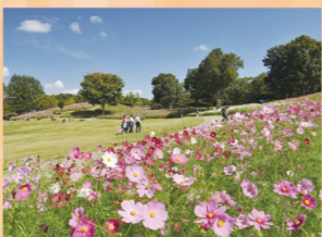
コスモス 9月中旬～10月下旬