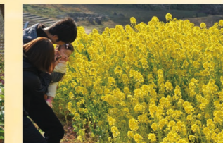
ナノハナ 2月中旬～3月下旬