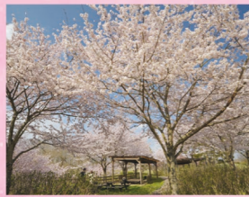
サクラ 3月中旬～4月上旬