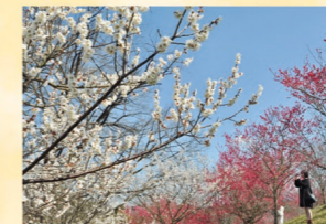
ウメ 2月上旬～3月上旬