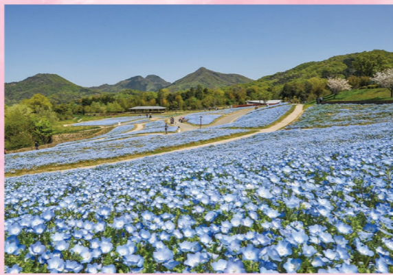
ネモフィラ 4月上旬～4月下旬