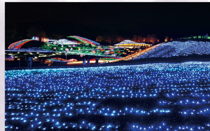
グランドイルミネーション イルミネーション装飾の色合いやデザインはその年のテーマによって異なります。