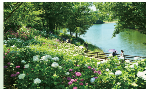
アジサイ 6月上旬～6月下旬