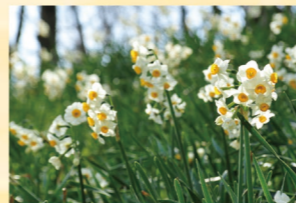
ニホンズイセン 2月上旬～2月下旬

冬と春の間、風の冷たさと日差しのぬくもりを感じる季節。ニホンズイセン、ウメ、ナノハナなど、園内各所で早春の花々が開花し、色の少ない風景に少しずつ彩りが増えていきます。木漏れ日の中を散策しながら、小さな春を見つけてください。