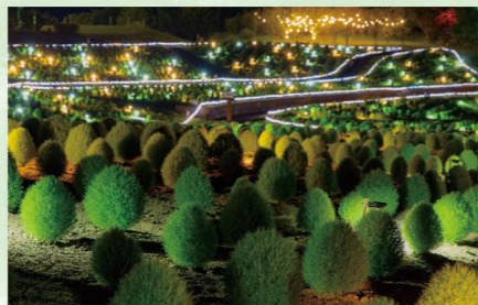
コキアライトアップほのか