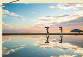
父母ヶ浜は日本有数の夕日絶景スポット。