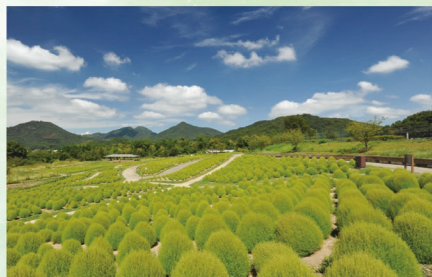
コキア緑葉 7月中旬～8月下旬