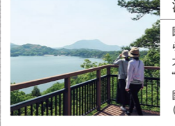
満濃池 園内の満濃池展望遊歩道からは、空海が改修した日本一大きな灌漑用のため池「名勝「満濃池」」が一望できます。園内から望む満濃池 (令和元年10月に名勝指定)