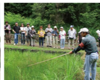
自然を学ぶ「ガイドウォーク」