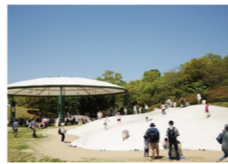
竜の子広場 「ふわふわドーム」など多彩な遊具が点在する遊びスポット。自由な遊び心と創造力をかきたてる子どもたちの広場です。