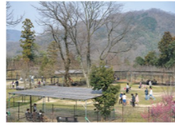
ドッグラン 愛犬たちと一緒に、のびのびと遊べる広場。大型犬・小型犬でエリア分けをしています。※ドッグラン利用の有無に関わらず、入園の際は「犬糞札」と「狂犬病予防注射済票」が必要です(コピー可)。