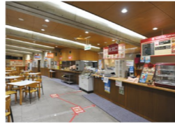
レストラン・売店 お食事をお楽しみいただけるレストランの他にも、ソフトクリームなどの軽食、お土産にぴったりな地域の特産品を販売している売店があります。グリーンパークまんのう tel.0877-79-1730