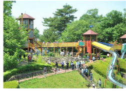
エクسسライダー 4つの岩からなる大型複合遊具。2本の超ロングローラー滑り台(約60m)をはじめ、ザイルクライマーなどの遊具が楽しめます。