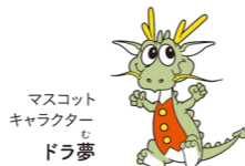
マスコットキャラクター ドラ夢

〒766-0023 香川県仲多度郡まんのう町吉野4243-12 問い合わせ まんのう公園管理センター Tel.0877-79-1700 最新情報は公式サイトをチェック! https://sanukimannopark.jp 下見や利用に関するご相談は、上記、電話番号までお気軽にご連絡ください。