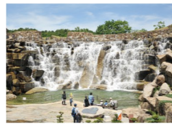
昇竜の滝 四国88景に選ばれた落差9mの巨大な滝。水が一気に流れ出す毎時00時の「瀑布」(約5分間)は圧巻です。

総面積350haの園内には、広大な芝生広場や子どもたちに人気の大型遊具、サイクリングコース、オートキャンプ場など施設も充実。広々とした公園で思い思いにお過ごしください。