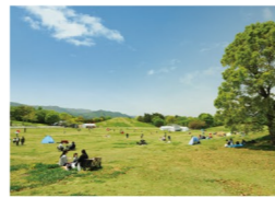
芝生広場 8つの小山に囲まれた約4haの緑のじゅうたん。周辺の花畑では季節の花が楽しめます。