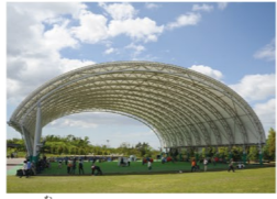
ドラ夢ドーム 雨天でも楽しめる人工芝の全天候型施設。幼児用の無料遊具があります。(1,600㎡ 収容人数約800名)