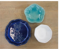
陶芸教室 粘土をこね、自分だけの皿が作れます。