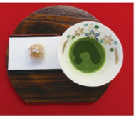
お茶席 伝統文化を気軽に体験できます。