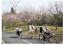
サイクリングコース 花畑などを観賞しながら、園内をぐるりと一周できる全長約6kmのコース。サイクリングセンターでは約500台の各種自転車を貸し出しています(有料)。