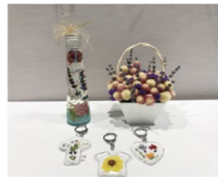
ハーブ教室 季節の花を使って様々な作品が作れます。

教室 ハーブ、陶芸、パン・ピザ、木工、トールペイント 体験 お茶席、炭焼き まんのう公園管理センター Tel.0877-79-1700