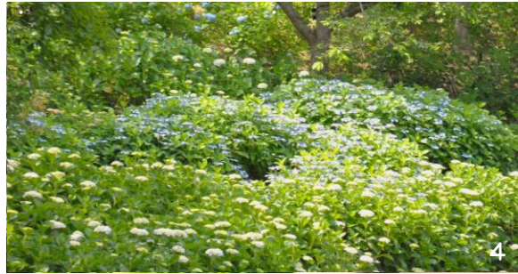
1.“ホンアジサイ” 2.カシワバアジサイ 3.ヤマアジサイ“クロヒメ” 4.全体的に咲き始め 全て2024年6月7日撮影(あじさい苑)