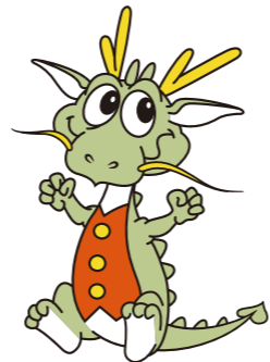
マスコットキャラクター「ドラ夢(ム)」