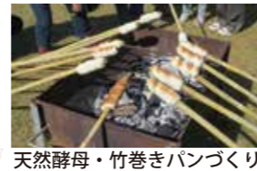
天然酵母・竹巻きパンづくり