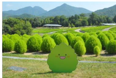
コキアのフォトスポットも登場中➡

10月上旬には、夏の緑色から少しずつ紅葉し始め、夏とはがらりと雰囲気が異なる 丘を紅に染める景色 が楽しめます。