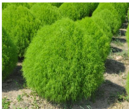
ユーラシア大陸（乾燥地）原産 ヒユ科の一年草

コキアは和名を「ほうき草」といい、昔はこの茎を乾燥させてほうきを作っていました。実（み）は“とんぶり”といい「畑のキャビア」として親しまれています。（※本公園のコキアは観賞用の品種です）7月上旬から夏の日差しを浴びてすくすく成長していくライムグリーンのコキアは、丸々とした可愛らしい形と、柔らかな感触が楽しめます。