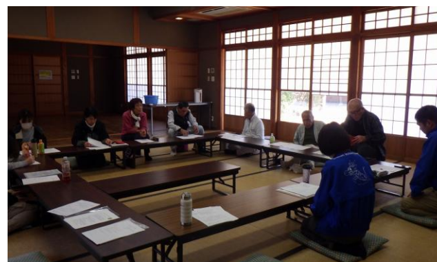
◆さぬきの森の会運営会議