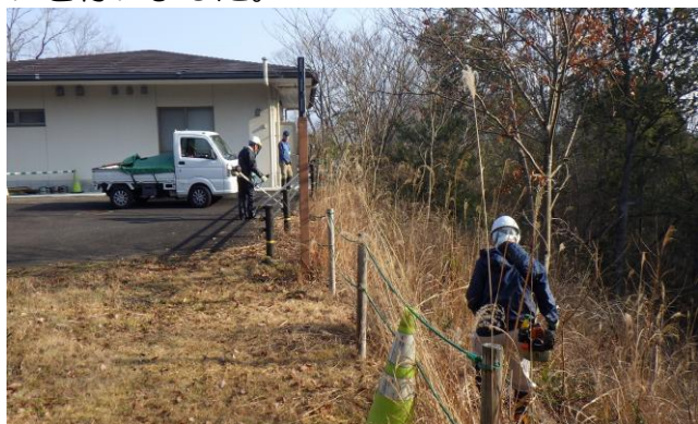
◆森の遊び広場整備

午前中は、「ヤブツバキ整備」「森の遊び広場整備」「藍のすり染め試行」「園路整備」を行いました。今回も暖かい気候に恵まれました。ヤブツバキ周辺の整備は、一段落つきましたが、森の遊び広場と園路の整備は、来月以降も引き続き行っていく予定です。「藍のすり染め」では、昨年採集した藍を冷凍保存していたもので、すり染めを行いました。生葉ですり染めをした時と比べると、色合いが少し異なるということでしたが、思い思いの作品ができたようです。来年度は、一般のお客様と一緒に藍の採集から作品作りまでができるように計画していきます。午後からは、さぬきの森の会第4回運営会議を行い、今後の活動内容や来年度に向けての話し合いを行いました。