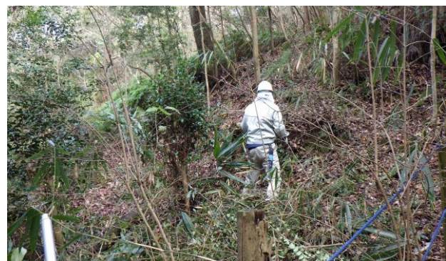
◆ヤブツバキ周辺整備

※12月21日（日）に予定をしておりました「それゆけ！きこり探検隊」は、雨天のため中止となりました。