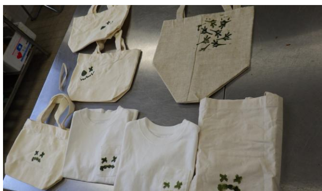
◆藍のすり染め作品